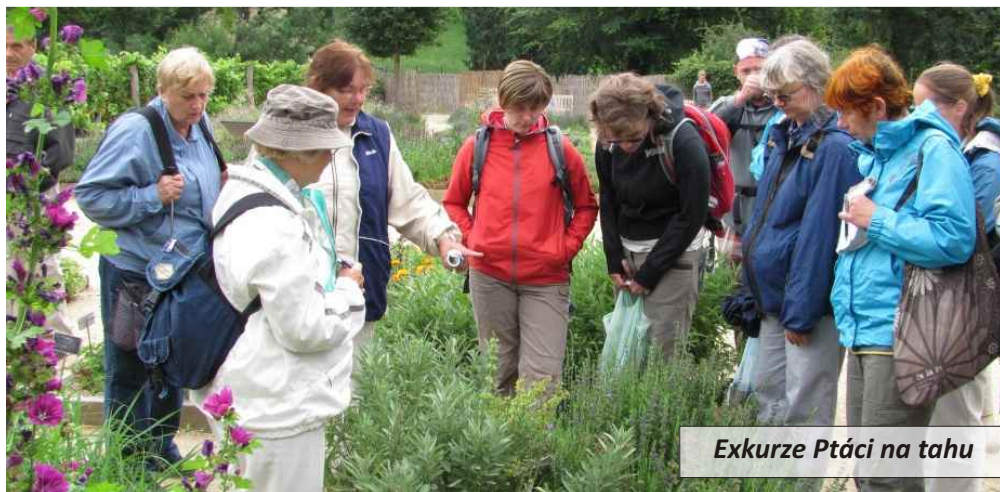
Exkurze Ptáci na tahu