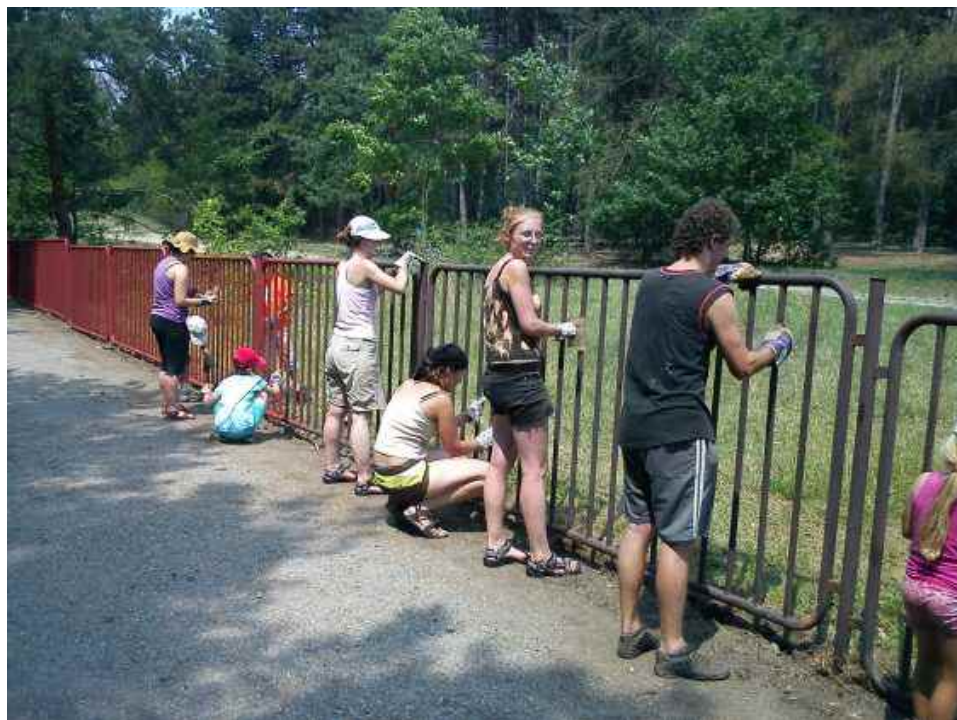
Údržba plotu okolo PR Kamenný vrch

Za podporu a dobrou spolupráci v roce 2012 děkujeme Českomoravskému cementu, a.s. a společnosti Kámen Zbraslav s.r.o., Jihomoravskému kraji, Správě CHKO Moravský kras, Magistrátu města Brna, ZO ČSOP PS Hády, ZO ČSOP Poníkva, obci Kobylnice, Fóru dárců a mnoho dalším.