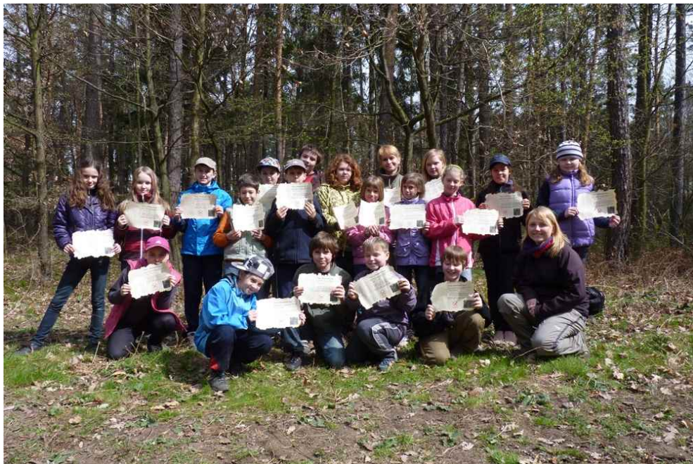
Žáci s glejty zakladatele lesa, které dostali po výsadbě buků

Projekt začal v říjnu 2010 úvodní schůzkou s učiteli a byl ukončen závěrečnou schůzkou pedagogy na začátku května roku 2012. Celkové trvání školního projektu bylo 1,5 roku. Modelový školní projekt byl zaměřený na lesní ekosystém a všechny jeho části byly zpracovány s ohledem na aktuální roční období. Záměrem bylo, aby probíraná témata, bylo možné propojit ve stejnou dobu s pozorováním daných dějů v přírodě. Pod vedením učitelů řešili žáci průběžně připravené aktivity a úkoly. Každé dva měsíce obdrželi učitelé manuál s podrobným popisem aktivit, sadu pomůcek potřebných k plnění aktivit a pracovní listy. Celkem bylo učitelům předloženo 7 sad úkolů. Žáci účastníci se projektu se po celou dobu (1,5 roku) starali o sazenice buků, které si na závěr vysadili a vytvořili tak nový les. Každému žákovi byl pak předán glejt zakladatele lesa. Do projektu byly zapojeny 4 brněnské školy, celkem šlo o 14 tříd v rozmezí od 2. do 4. Třídy. Celkový počet účastníků byl 328 (315 žáků a 14 učitelů). Od začátku projektu došlo k drobným změnám v počtech dětí v jednotlivých třídách a také se částečně změnili spolupracující učitelé. Na konci roku 2012 byla vydána metodika v nákladu 1000 ks a je určena na rozdej učitelům.