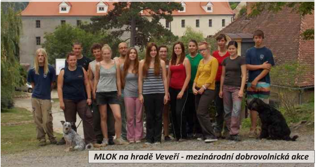
MLOK na hradě Veveří - mezinárodní dobrovolnická akce