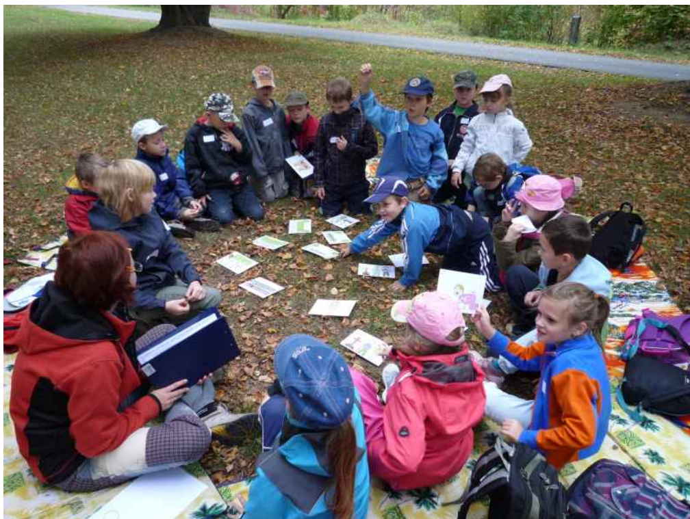
Den stromů pro ZŠ Hamry - hra na srovnání délky života člověka a lesa

Rezekvítek je akreditovanou vzdělávací institucí pro DVPP akreditace MŠMT č. j. 24018/2007-25. Nyní máme akreditovány 4 typy vzdělávacích akcí. V roce 2012 jsme uspořádali 8 metodických seminářů pro pedagogy, jednak k práci s výukovými pomůckami Rezekvítku, jednak k využívání interaktivní tabule pro ekologickou výchovu.